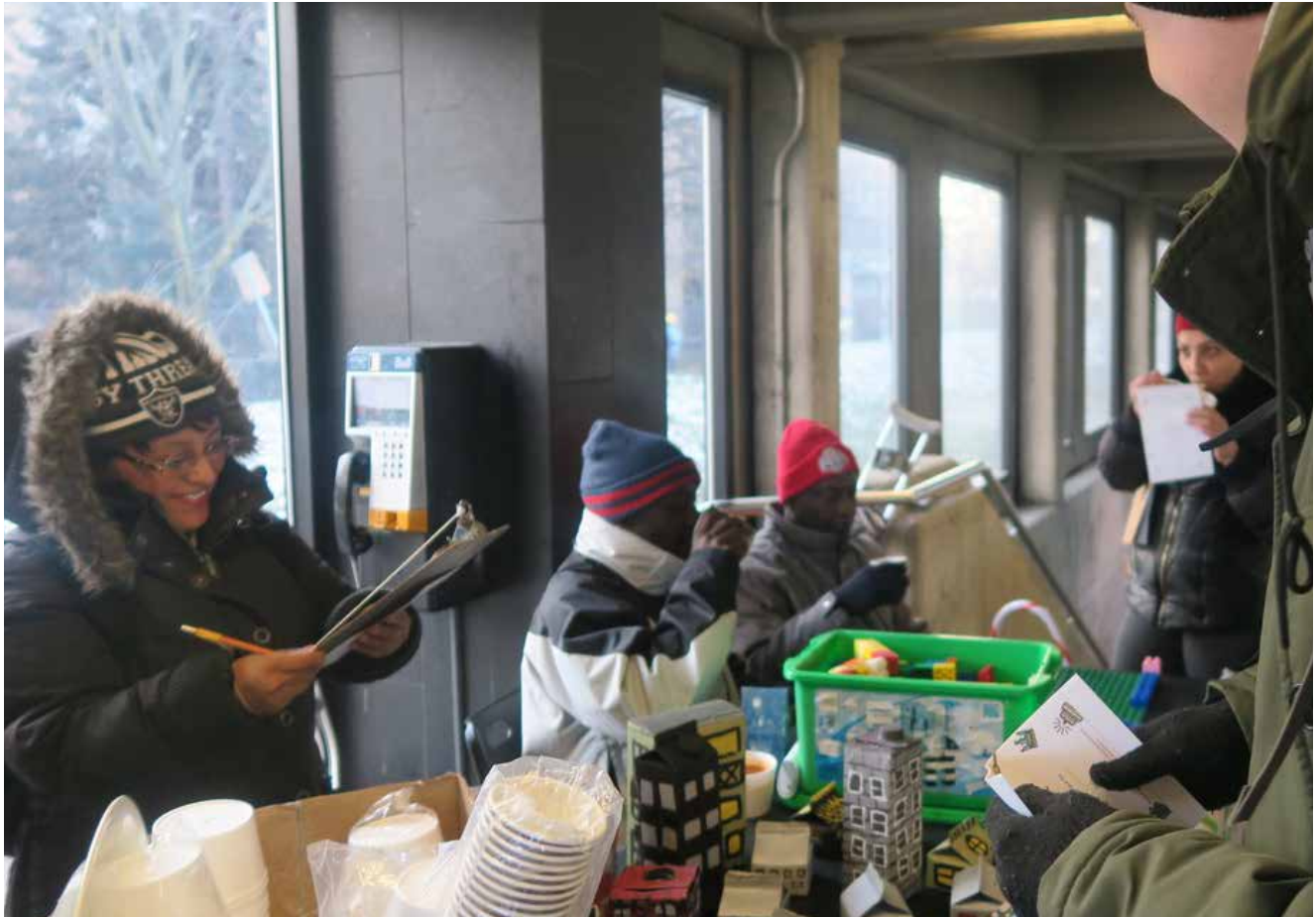
Une participante observe et note les actions de son collègue

Après l'action, concevez un diaporama constitué de photos prises par l'artiste et une ou deux membres du groupe qui avaient pour tâche de documenter l'action en photos.